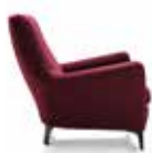
5 DENNY POLTRONA CM 88X95 H88